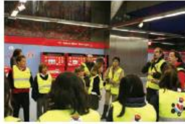
Visitas a Cocheras