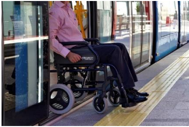
Los trenes MLO están totalmente adaptados, lo que facilita el acceso a personas con movilidad reducida